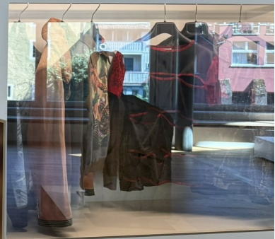
Collections of Modestats Oberlin