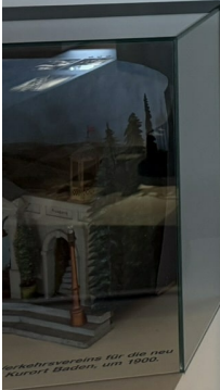
Architectural drawing for the new Kurort Baden, 1900