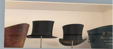
Zylinder mit Schwanke, Kultur & Diebold Baden, 1910