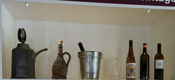
Gefäße für den Weinausschank, ca. 1750-2023