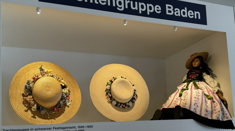
Trachtenpuppe in schwarzer Festtagstracht, 1930–1950 Damenhüte zur Festtagstracht, ca. 1939 und 1995