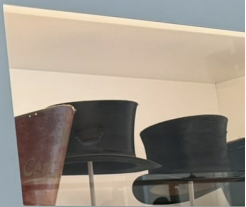
Zylinder mit Schachtel, Hutmarkt Diebold Baden, 1870