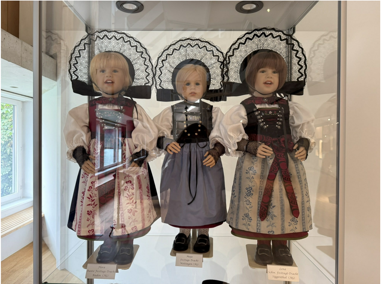
Flora Bunte Festtags-Tracht Baden (AG)