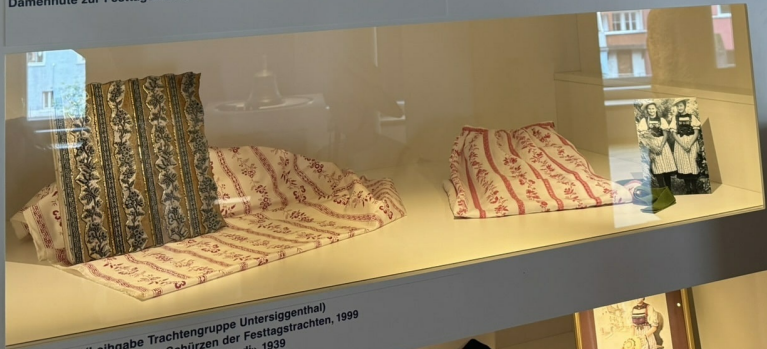
Druckstock (Leihgabe Trachtengruppe Untersiggenthal) Drucker Stoff für Schürzen der Festtagstrachten, 1999 Käufer an der «Land» 1939